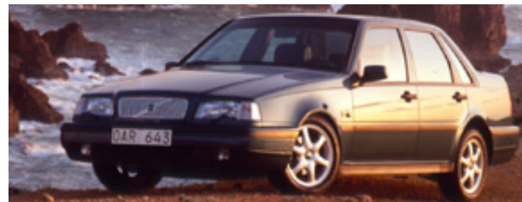
Volvo 460 SE 2,0 med SE-paket, 1995 års modell. Aluminiumfälgar "Cetus" (ingick i SE-paketet).

INTRODUCERADES SOM 1990 ÅRS MODELL. EN VERKLIGT KÖRGLAD BIL MED GOD FÖRMÅGA ATT DRA TUNGA LASS. MED SIN HÖGA UTRUSTNINGSNIVÅ, ÄR VOLVO 460 EN AV MARKNADENS MEST PRISVÄRDA BILAR I DETTA SEGMENT. HÖG INBYGGD SÄKERHET OCH ETT VÄL UTBYGGT SERVICENÄT TRYGGAR ETT SÄKERT BILÄGANDE.