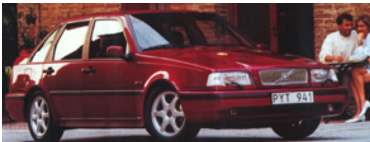
Volvo 440 Turbo med Turbo-paket, 1995 års modell. Aluminiumfälgar "Cetus" (ingick i Turbo-paketet).