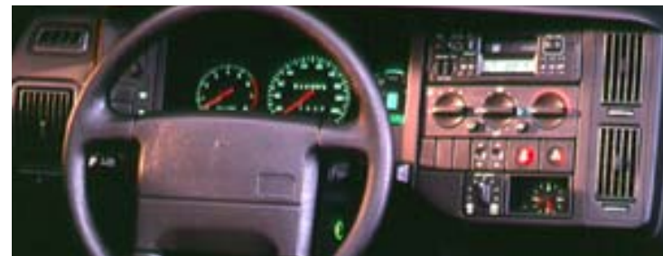
Interiör 440 SE, 1995 års modell. Luftkonditionering (AC) och färd dator var extrautrustning.