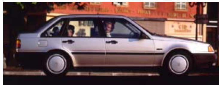
Volvo 440 GL, 1991 års modell.

VOLVO 440 ÄR EN KOMPACT OCH ERKÄNT PRISVÄRD FAMILJEBIL MED MÅNGA INBYGGDA STORBILSEGENSKAPER. DEN BEKVÄMA INTERIÖREN OCH DEN FUNKTIONELLA FÖRARMILJÖN UTGÖR VÄSENTLIGA TILLSKOTT TILL DEN HÖGA KOMFORTEN OCH SÄKERHETEN.