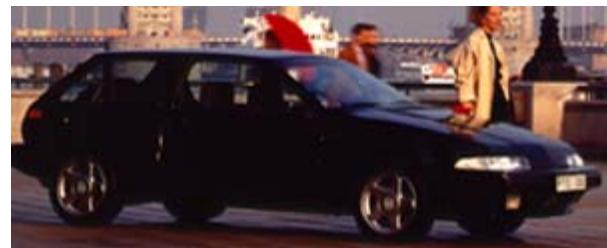
Volvo 480 Turbo, 1995 års modell. Standardutrustad med aluminiumfälgar "Taurus".

VOLVO 480 ÄR SPORTBILEN - ELLER KUPÉMODELLEN - I 400-FAMILJEN. MED ELLER UTAN TURBO HAR VOLVO 480:S MOTOR KRAFTRESURSER ÖVER ÄVEN FÖR AVANCERAD KÖRNING OCH SÄKRA OMKÖRNINGAR. DETTA TILLSAMMANS MED DEN RIKLIGA STANDARDUTRUSTNINGEN, GÖR VOLVO 480 TILL EN EFTERTRAKTAD BIL MED MYCKET SPECIELL KÄNSLA.